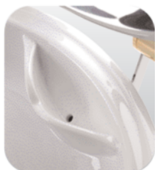
A cseppgyűjtő felfogja a kondenzvizet