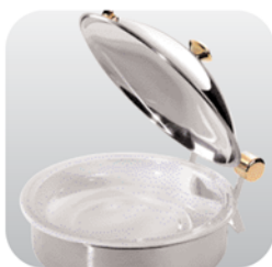
Kerek porcelántálya a kerek chafer-hez